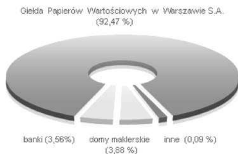
Rysunek 1. Struktura akcjonariatu BondSpot SA (stan na marzec 2010 r.)