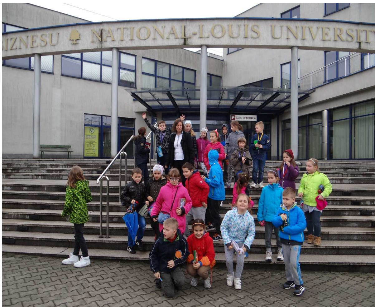
Klasa II B przed budynkiem głównym uczelni

Przed głównym wejściem do budynku C uczelni atrakcją okazał się Dzwon Wolności, każdy musiał sprawdzić jego działanie.